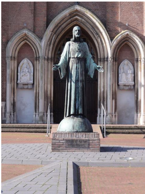
H. BARBARAKERK TE DREUMEL

Bij het opmaken van de ‘acte van inventaris’ was