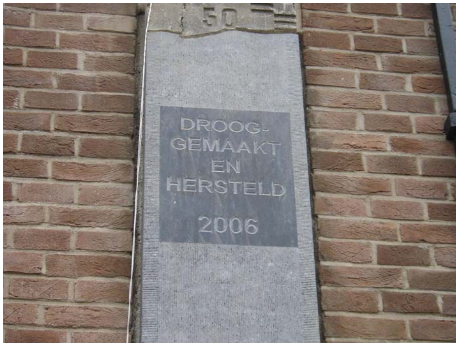
Gedenksteen welke onthuld is tijdens de feestelijke opening van de gerestaureerde sluisen.

Elke donderdag en elke zaterdag in de oneven weken van 10.00 tot 15.00 uur.